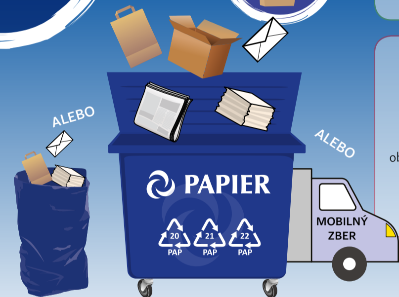
PODĽA SYSTÉMU ZBERU VO VAŠEJ OBCI