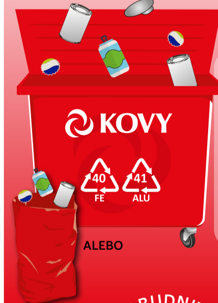
PODĽA SYSTÉMU ZBERU VO VAŠEJ OBCI