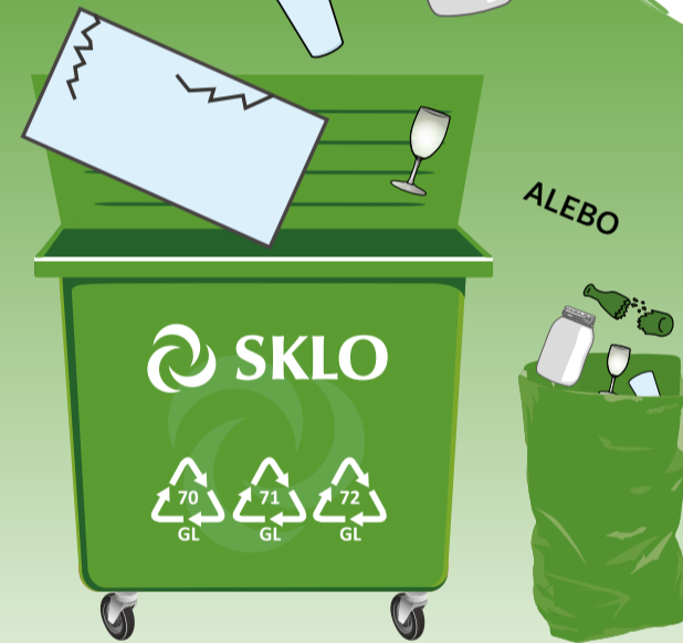
PODĽA SYSTÉMU ZBERU VO VAŠEJ OBCI

30 plastových fliaš sa zmení na fleecovú bundu?